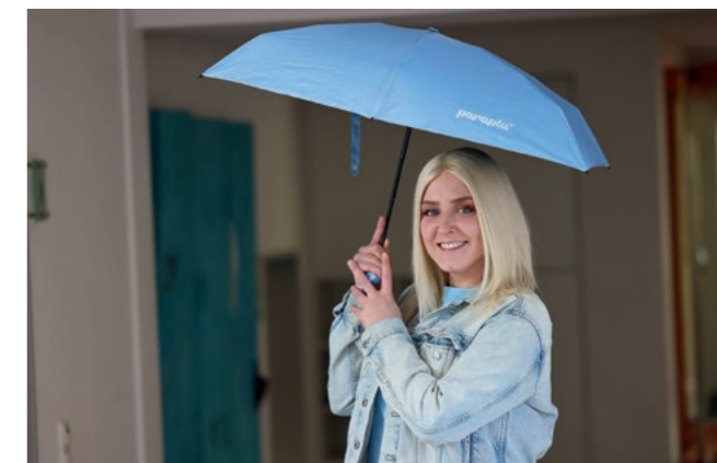
Die Band „paraplue“ im Karnevaleinsatz – und unsere neue Kollegin „mittendrin“.